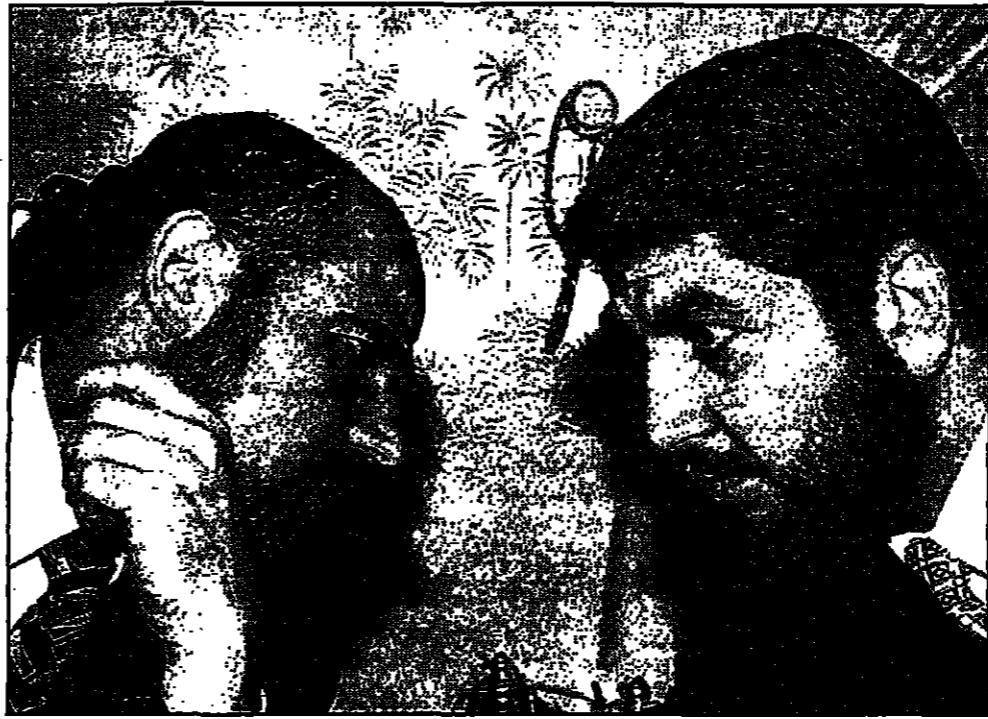
موسى أبو مرزوق يتحدث في مؤتمر صحفي في عمان والى جانبه رئيس المكتب السياسي لحماس خالد مشعل

عمان - «القدس العربي» من بسام يدارين أكد رئيس المكتب السياسي السابق لحركة المقاومة الإسلامية (حماس) أنه وقع على وثيقة مع السلطات الأمريكية للتزم فيها بعدم العودة لمطالعة الولايات المتحدة مقابل الإفراج عنه. وقال في مؤتمر صحفي عقده في عمان أمس أن الوثيقة «بالتحديد» وقعت قبل أسبوعين، فرفضت عليه أيضا التخلي عن بطاقتة الهجرتة (غرين كار) وعدم أي دعوى قضائية ضد الولايات المتحدة من قبله.